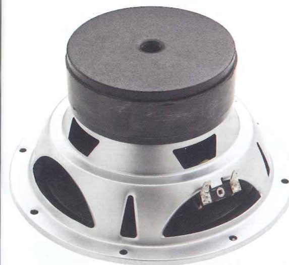
Il cuore dell'Active 8 Micro è l'altoparlante più piccolo della serie 37. Un 20 cm, con bobina mobile da 38 mm in grado di digerire abilmente potenze nell'ordine dei 140 W max.

mento. Internamente, invece, il box è diviso in due camere separate. Quella superiore accoglie, come detto, la "faccia elettronica" dell'amplificatore. Quella inferiore è totalmente dedicata all'altoparlante. A conti fatti, quindi, il volume di caricamento è nettamente inferiore ai 10 litri.