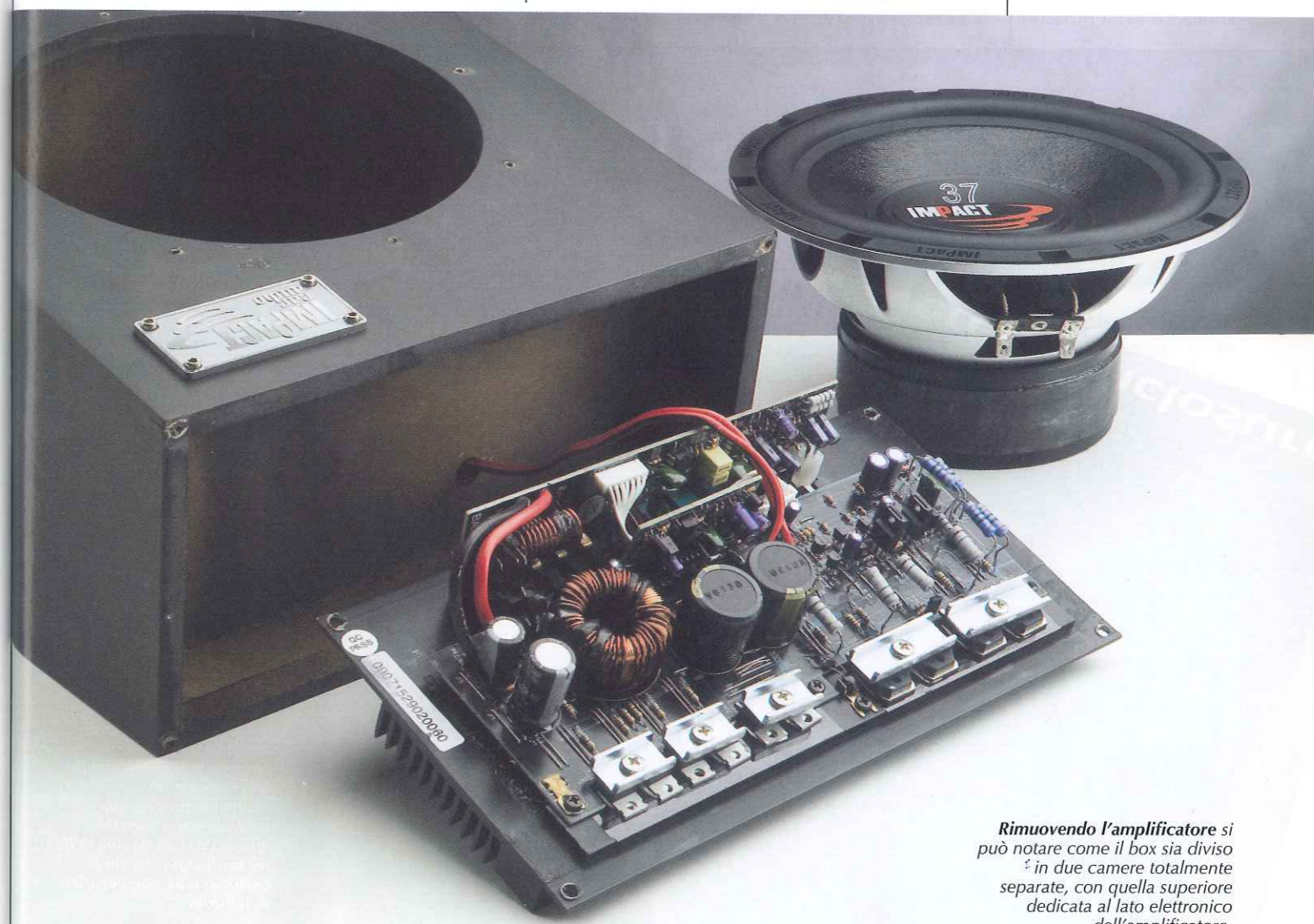
Rimuovendo l'amplificatore si può notare come il box sia diviso in due camere totalmente separate, con quella superiore dedicata al lato elettronico dell'amplificatore.