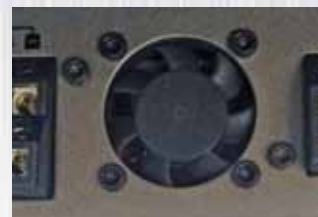
Ventola di stabilizzazione temperatura Fan to stabilize the temperature