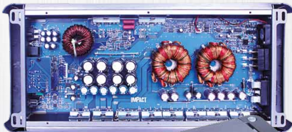
Ventola di stabilizzazione temperatura Fan to stabilize the temperature